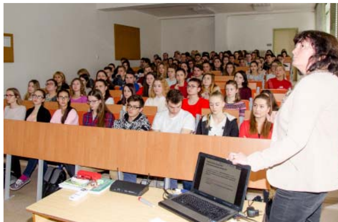
Prednáška pre študentov Obchodnej akadémie Dr. Milana Hodžu v Trenčíne