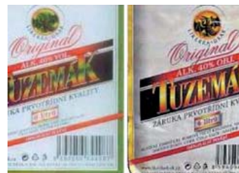
Originál a podvrh. Vľavo je pôvodná etiketa Likérky Drak a vpravo falošná. Rozdiely sú v texte zloženia a tiež v označení (správne je ALK . 40 % VOL. a chybné ALK. 40 % OBJ.). Výrobca liehovín zdôrazňuje, že jeho produkty sú bezpečné, čo potvrdili laboratorné testy. Naopak, životu nebezpečné sú alkoholické nápoje vo fľašiach, ktoré niekto sfaľšoval.