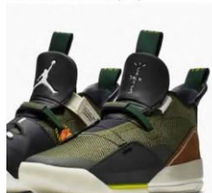
Jordan XXXIII "Travis Scott" (2019)

. Častokrát išlo o kolekcie, ktoré boli vypredané napriek svojej cene v priebehu niekoľkých hodín či dní (dôkaz č. 6).