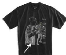
Jordan Brand x Travis Scott Travis Scott Tee