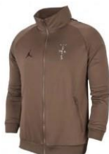
Jordan Brand "Cactus Jack" Apparet (2019)